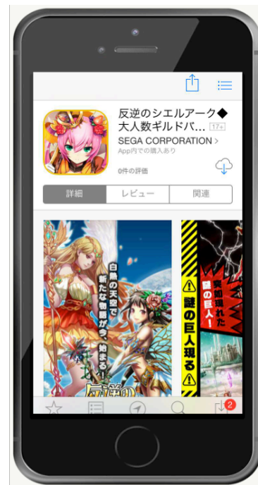
動画をワンクリックするだけで 目的のページに誘導

本サービスでは動画広告が、スマートフォンの画面を遷移することなく自動で再生され、動画をクリックするだけで目的のページに誘導することが可能です。再生される動画広告は最大30秒となっており、商品の魅力を深く伝えることが出来、高い広告効果が期待できます。尚、本サービスはスマートフォン向けWEBページ及びアプリ（iOS、Android）の両方へ広告配信が可能です。