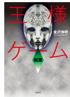
小説版「王様ゲーム」

「王様ゲーム」は200万以上の作品が公開されている「E★エブリスタ」の中でも、累計閲覧回数4,800万回以上を記録した屈指の人気作です。その人気からユーザー投稿作品としては異例となる様々な展開が行われており、2009年に書籍化され、翌2010年にはコミック化、そして2011年12月には映画『王様ゲーム』が公開されました。2012年11月28日(水)には待望のコミック新作「王様ゲーム 終極(1)」が2013年3月19日(火)に「王様ゲーム 起源」が書籍化され、株式会社双葉社より発売されています。