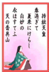
あの百人一首をモバイルで気軽に楽しむことができます

また、SNSのソーシャル性を活かしたランキングやマイミクとの対戦も行なうことができ、モバイルを通じて友人とコミュニケーションを深めながら、学習効果を競うことができます。さらには、5級から5段までの検定試験があり、自分の百人一首に対する理解度を確認することまでモバイル1つでできるのです。