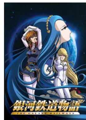
「銀河鉄道物語」 (C)松本零士/プラネット・銀河鉄道管理局

本サービスでは作品をダウンロードするだけでなく、作品を多方面から楽しめるファンサイトとなることを目指しています。『アニメ公式！チャンネル』では今後、新たな作品を随時追加することになっており、番組内の作品を充実させていく予定です。