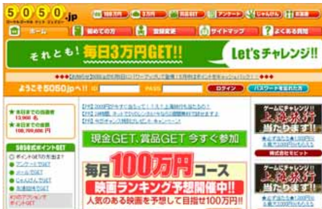
PC版トップページ(イメージ)